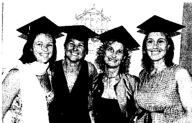
Alcune donne imprenditrici allieve del MBA Imprenditori

La lista degli appuntamenti con altre storie di successo è lunga, per continuare a valorizzare le eccellenze del nostro territorio. Per informazioni: Area Imprenditorialità CUOA, tel. 0444 333745.