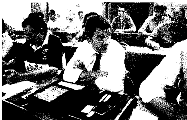
Alcuni partecipanti in aula durante un MBA Imprenditori

I casi di alcuni imprenditori illuminati che hanno condiviso con successo un network con altre aziende